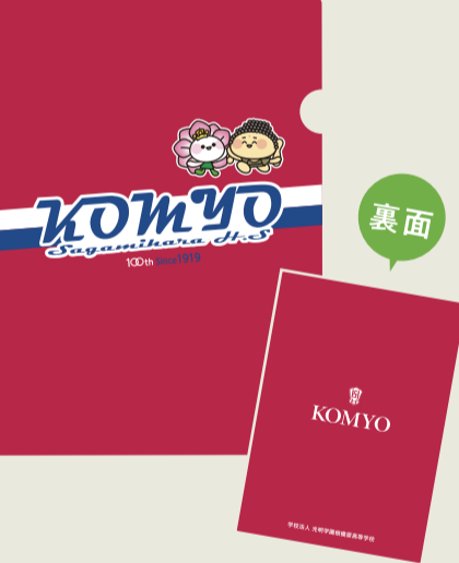
臙脂色 ¥100 (税込)