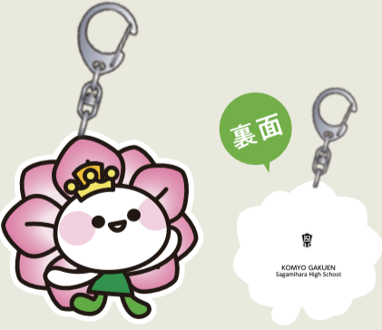
ハッサー キーホルダー ¥600 (税込)