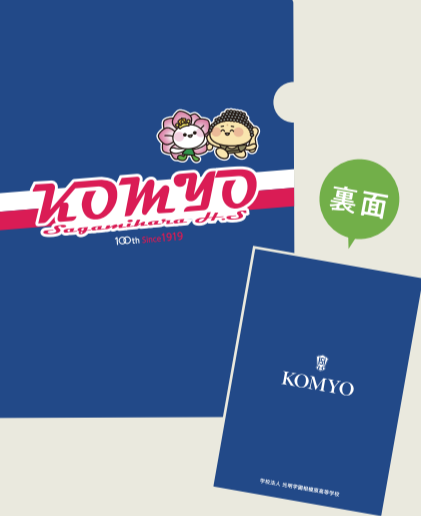
紺色 ¥100 (税込)