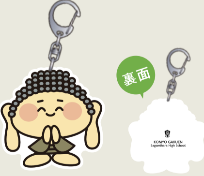
なむポン キーホルダー ¥600 (税込)