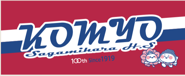
臙脂色 ¥1,000 (税込)