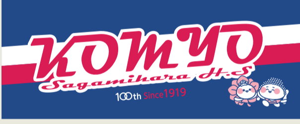
紺色 ¥1,000 (税込)