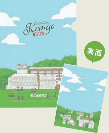
イラストバージョン ¥100 (税込)