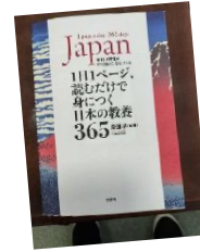
文響社 齋藤孝 (監修)