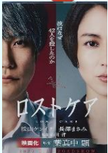
光文社文庫 葉真中顯：著

「ゲームの名は誘拐」 やり手エリート広告プランナーが、仕事で屈辱を味あわされた大手企業副社長の令嬢が家出するのを目撃し、その令嬢と手を組んで令嬢を人質として身代金誘拐という騙し合いゲームを実施する。 2003年に「g@me.」として映画化され注目をあびた本です。 是非、ご愛読を！！ S 教諭