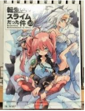
かなで文庫 小説：伏瀬 イラスト：もりよ