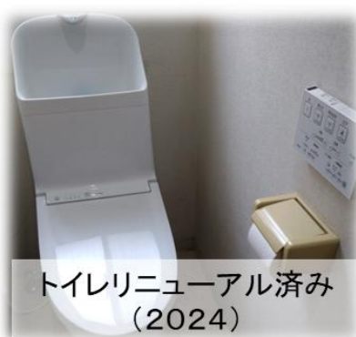
トイレリニューアル済み (2024)