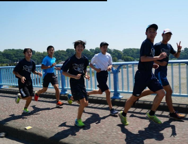
◎三増公園陸上競技場