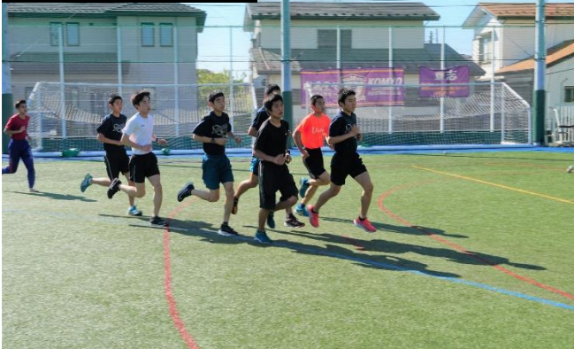
◎人口芝グラウンド