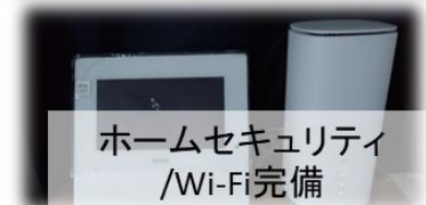
ホームセキュリティ /Wi-Fi完備