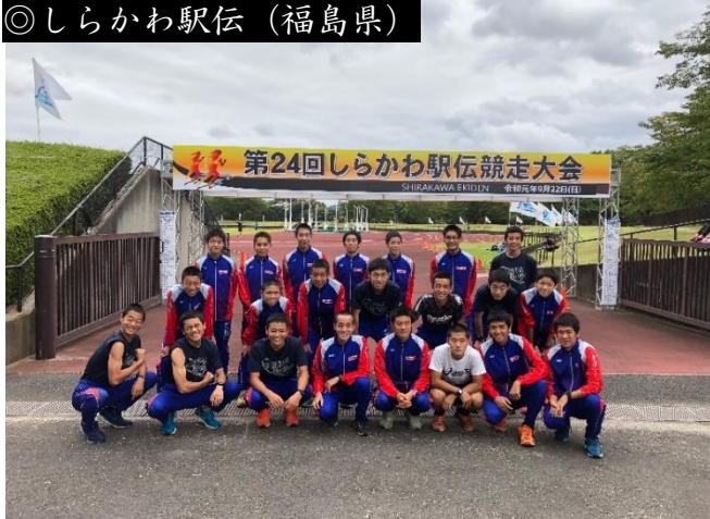
◎しらかわ駅伝（福島県）