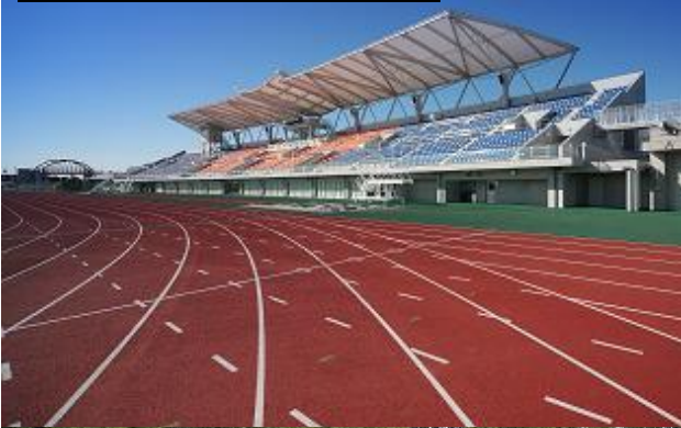
◎相模原ギオンスタジアム