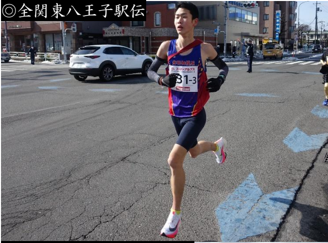
◎全関東八王子駅伝