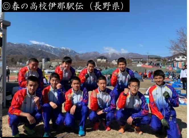
◎春の高校伊那駅伝（長野県）