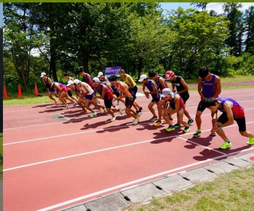
◎滝ヶ原自衛隊合同演習