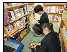
2025年度 図書委員による蔵書整理の様子！

この図書室の大きな力になるのが図書委員の皆さんのパワーです。月～金の昼休みと放課後のどこか1コマ30分パワーを貸してくれませんか。